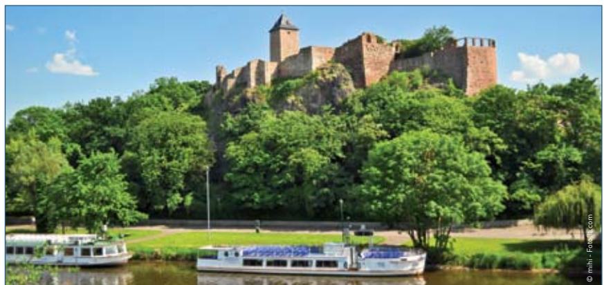
Auf der historischen Burg Giebichenstein in Halle/Saale befindet sich der beliebte Kunstcampus.

werbstätigen insgesamt sowie die Zahl der sozialversicherungspflichtig Beschäftigten (Wohnort/Arbeitsort) erhöhte sich ebenfalls.