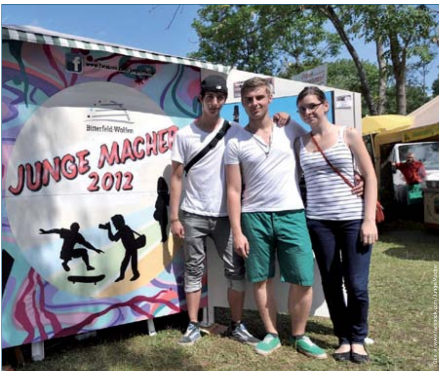
„Junge Macher“ stellen ihre Projekte beim 21. Vereins- und Familienfest in Bitterfeld-Wolfen vor.